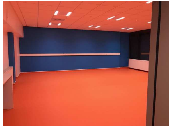
Classe des petites et moyennes sections