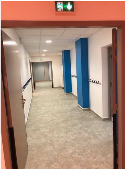
Couloir d'accès aux classes

La première phase des travaux de l'école primaire des pelands a été livrée le 18 décembre 2020. Elle comprend la livraison de deux classes, de la salle de repos, des couloirs d'accès aux classes et aux sanitaires, la salle des professeurs des écoles et le bureau de la directrice. La deuxième phase a débuté le 11 janvier 2021