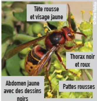
Frelon asiatique - Vespa Velutina